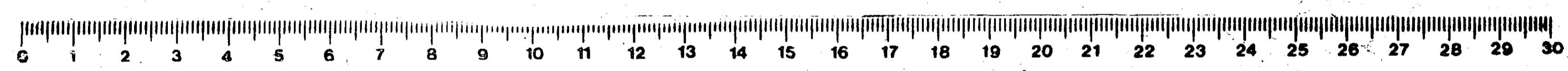
Imitação Joaquim Nabuco

PARA EXPORTAÇÃO Algodão A 11$400 por 15 kilos Couro Seccos salgados na base de 12 kilos nominal a 80r Verdes nominal a 460 Por pipa para exportação e com marcas Alcool Por pipa nominal a 270$000 Aguardente Por pipa nominal a 150$000